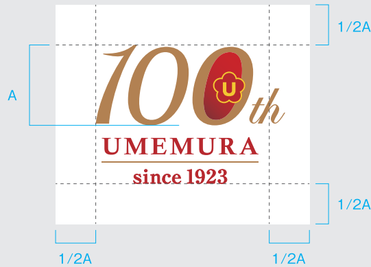
B-01 / 基本の組み合わせ