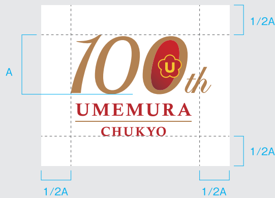
C-01 / 基本の組み合わせ