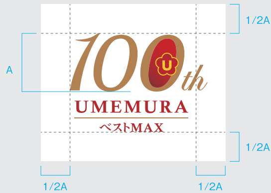
A-01 / 基本の組み合わせ